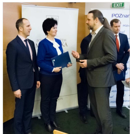
Laureaci konkursu „Najlepiej zagospodarowana przestrzeń publiczna w Wielkopolsce”